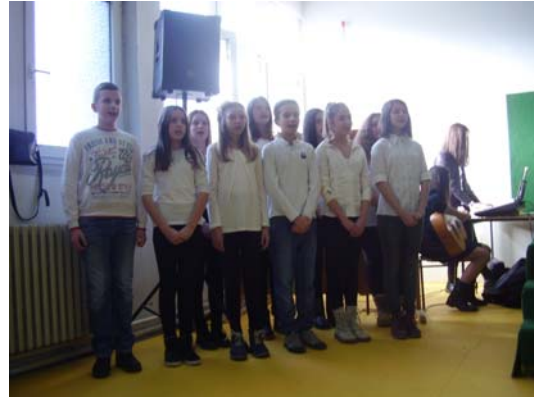
мали хор малих певача- песма Бранка Радичевића