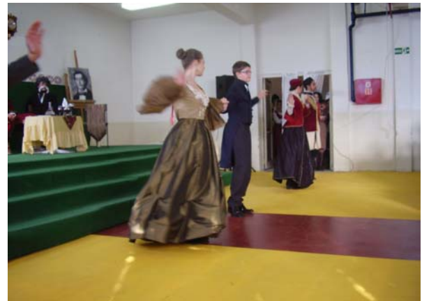
Валцер Ане и _____